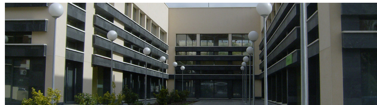
Centro Autorizado por la Consejería de Familia y Asuntos Sociales con Registro nº C3595

CENTRO DE DÍA, CENTRO DE REHABILITACIÓN INTEGRAL Y CENTRO DE FORMACIÓN