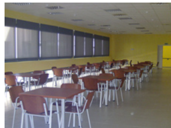
Es el primer centro de referencia a nivel nacional de estas características.

un Centro de Rehabilitación Integral y un Centro de Formación, además de la sede social de AEDEM-COCEMFE.