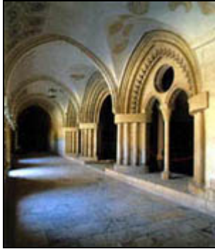
Monasterio de las Huelgas

Día completo en Burgos, hay mucho que ver en esta ciudad, por supuesto utilizaremos las bicis y el autobús, y nos guiarán en esta visita nuestros amigos del Centro.