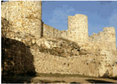
Castillo de Burgos