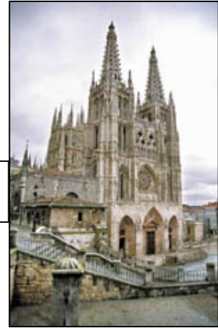
Catedral de Burgos